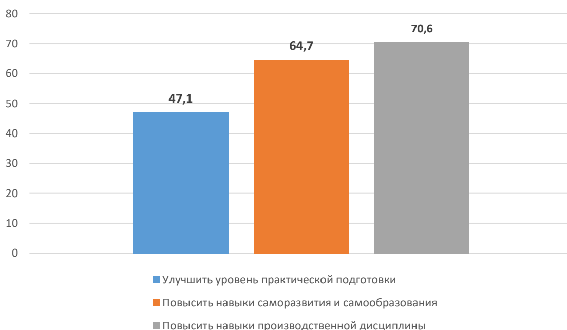
Рисунок 3. Что, по Вашему мнению, следует улучшить в подготовке выпускников? (в %)

Ответы на вопрос «Что, по Вашему мнению, следует улучшить в подготовке выпускников?» представлены на рисунке 3. Отметим, что, по мнению работодателей, выпускнику крайне важно повысить навыки саморазвития и самообразования, а также навыки производственной дисциплины.